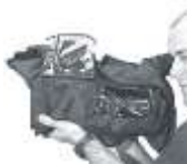
Regenschutz für Fx1 / Z1 € 119,-