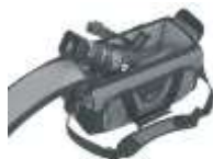
Taschen ab € 69,-

weitere interessante Produkte im Bereich Video finden Sie auf www.digitalsystems.at