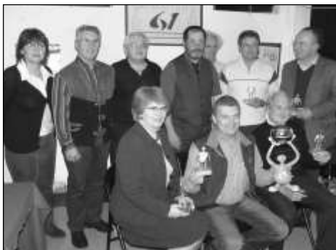
Jury und Preisträger fühlten sich wohl.