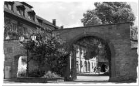
Veitshöchheim - Rathaus

Ein weiterer Höhepunkt wird wieder der „World Minute Movie Cup“ sein. Am Freitag, dem 3. September abends, treffen sich die besten Ein-Minuten-Filme aus 30 Ländern zu einem lustigen Wettstreit. Ein herrlicher Spaß, der sich zu einem Renner entwickelt hat.