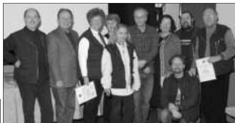
Die Teilnehmer des FVK St. Pölten

Sitzt man dann endlich bei Tisch und genießt das, was einem schon die ganze Zeit den Geruchssinn strapaziert, ist es meiner Ansicht nach das Tüpfelchen auf dem „i“, wenn man dabei in einer Runde von gleichgesinnten Freunden weilt. Der FVK St. Pölten war stark vertreten. Was nur zeigt, dass wir ein Klub von Dokumentarfilmern sind.